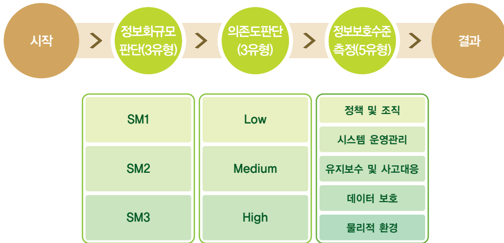
정보화 예산 대비 정보보호 투자비율

온라인 상에서 손쉽게 기업의 정보보호 수준을 측정하고, 미흡한 부분에 대한 정보보호 대책을 제시하는 서비스입니다. 한국정보보호진흥원 홈페이지(www.kisa.or.kr)에 접속하여 객관식 설문을 체크하는 방식으로, 정보시스템에 대해 잘 알고 있는 CEO나 정보시스템 담당자가 측정하기를 권고합니다. 처음 사용자의 경우 약 30분 정도의 시간이 소요됩니다.