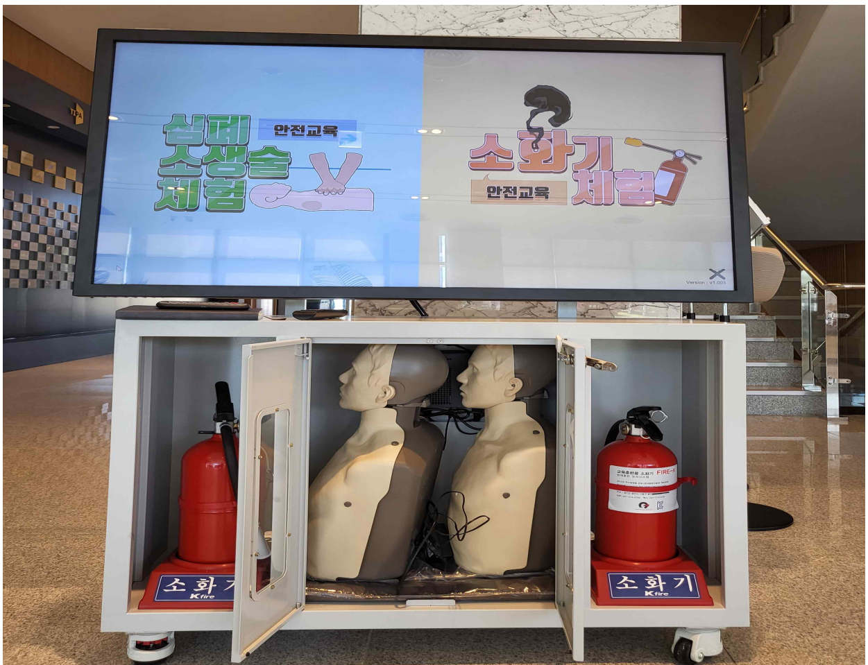
(사진설명) TIPA 임직원의 긴급상황 대응 능력 향상을 위해 본원 1층 로비에 소화기 사용과 심폐소생술을 실습할 수 있는 키오스크 설치 모습