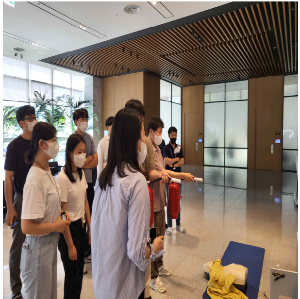
(사진설명) TIPA 세종 본원에서 직원들을 대상으로 긴급 재난상황 대응 모의훈련을 진행하고 있다.