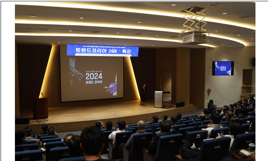
[사진 2] 다가올 2024년을 준비하기 위해 지역주민과 R&D수요기업 등 230여명이 참석하여 강의를 듣고 있다.