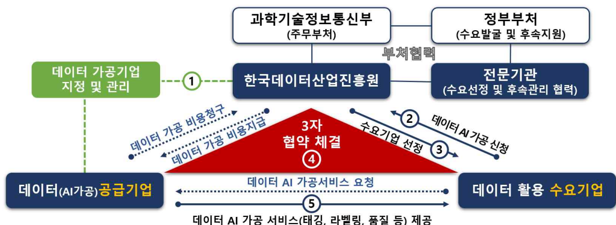
< AI 가공 바우처 지원 추진 체계 >